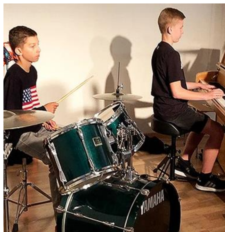
Gott feiern - Kinder in der Gesamtgruppe