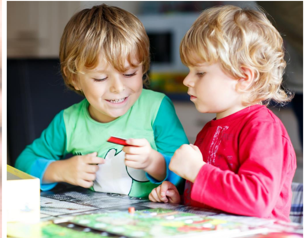
Kinder mit anderen Kindern unter sich