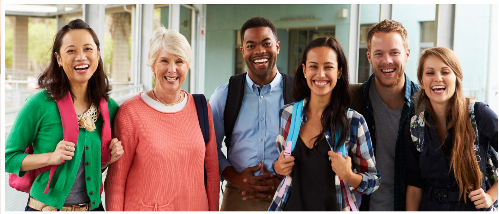
Das Team als wichtige Ressource für Kinder