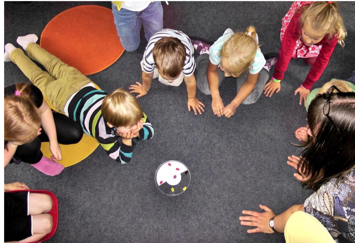
Kinder in kleinen Gruppen